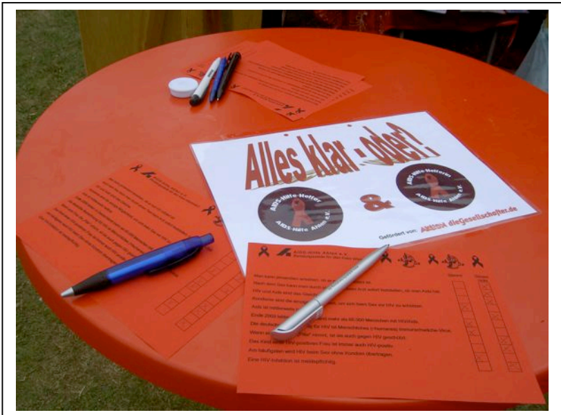
Eine Station des Präventionsparcours „AIDS-Hilfe-Helfer“